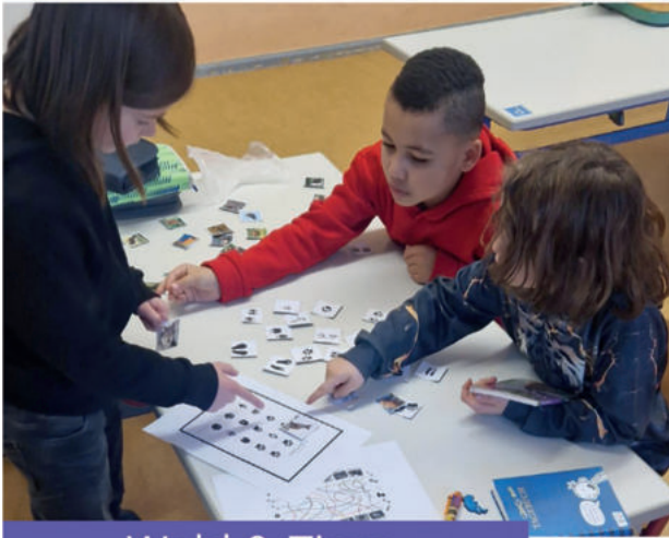
Wald & Tiere